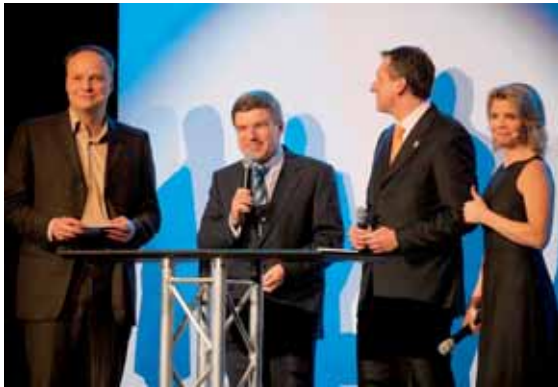
Dr. Thomas Bach und Dr. Peter Kurz im Interview