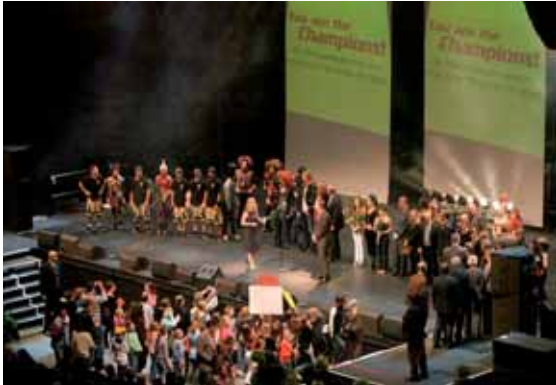
Das große Finale mit allen Stars des Abends auf der Bühne