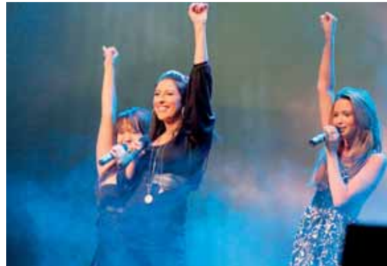
Die erfolgreiche Nachwuchsband Monroe in Aktion

Erwartungen übertroffen. Die Jury legte bei ihrer Bewertung insbesondere auf Vorbildhaftigkeit, Kreativität, Nachhaltigkeit und Wirtschaftlichkeit Wert.