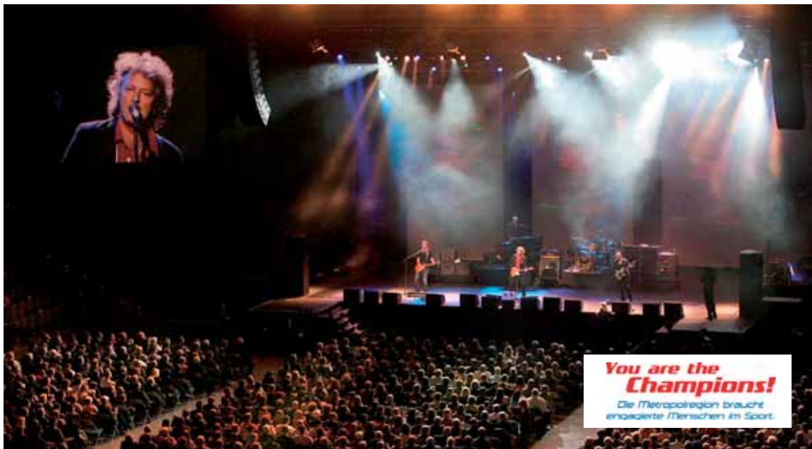
BAP rockt mit 10.000 Ehrenamtlichen beim Dankeschön-Event

Ein Fallbeispiel für ein emotionales Sponsoring-Engagement