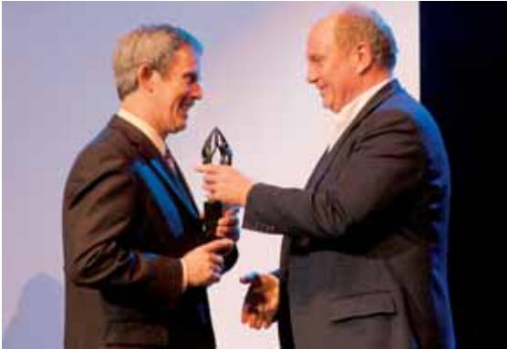
Preisverleihung der Kategorie „Trainer“ durch Uli Hoeneß